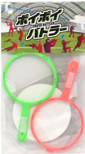
商品(個包装)パッケージイメージ

懐かしくて新しいスポーツ玩具【ポイポイバトラー】が新発売! 目を守り安全に、水鉄砲と広場さえあれば子どもから大人まで、 運動に自信が無い方も楽しめるチームスポーツが早くも話題!